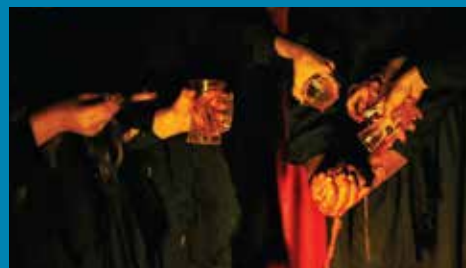
ترال ستا جوسال