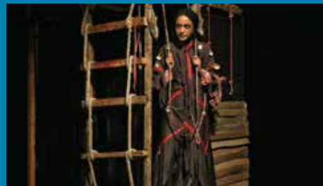
سی بودن سی نبودن