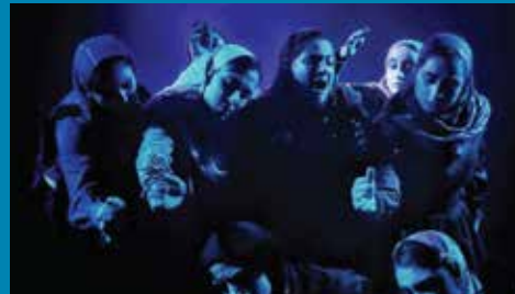
فقط مکنارموباز کردم کمی موهامو ببینه